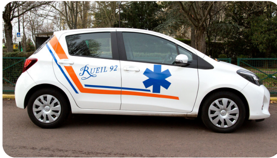
VSL TOYOTA YARIS HYBRID