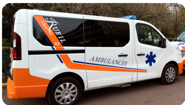
Ambulance RENAULT Trafic Catégorie C

Des ambulances et des équipements performants