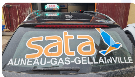
TAXIS Conventionnés SATA

Les Taxis SATA sont conventionnés et réservés exclusivement aux transports sanitaires avec prescriptions médicales TAP. Nos conducteurs ont tous une carte professionnelle et exercent selon les procédures et contrôles sanitaires du groupe.