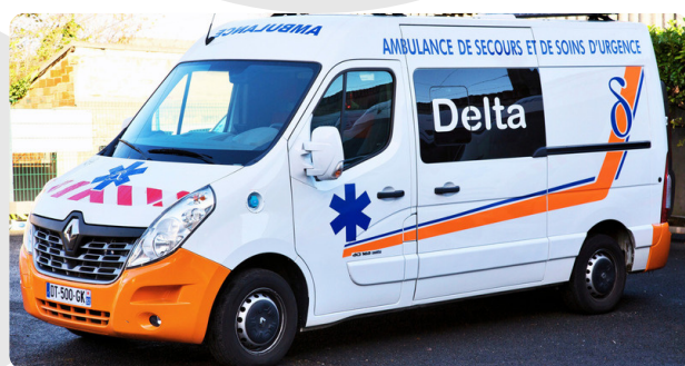
Ambulance RENAULT MASTER Catégorie A "Grand Volume"

Le matériel embarqué dans nos ambulances et VSL répond aux exigences de la liste préfectorale définie pour les véhicules sanitaires conventionnés selon les catégories A, C et D.